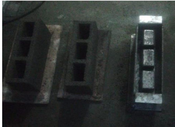
Figura 2. Matriz bloques convencionales

Mediante el diseño de la matriz se logró conseguir el resultado deseado con medidas simétricas los bloques son de 20x40x10 cm.