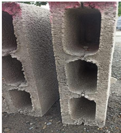
Figura 3. Prototipo de bloque ecológico con material PET

Mediante el diseño de la matriz se logró conseguir el resultado deseado con medidas simétricas los bloques son de 20x40x10 cm.